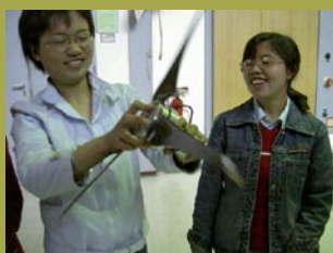
Praktische Ausbildung Rotordynamik im Windkanal

Die Deutsche WindGuard Dynamics GmbH gehört zur Gruppe der Deutsche WindGuard mit Sitz in Varel und bietet schwerpunktmäßig Ingenieurdienstleistungen zur Optimierung der Performance von Windenergieanlagen (WEA) an. Im Bereich Knowledge Transfer führen wir Fortbildungskurse, Workshops und Mitarbeiterschulungen zur Qualifizierung und Weiterbildung durch. Wir haben modulare Kursprogramme für Brancheneinsteiger und Fortgeschrittene entwickelt, bieten aber auch Veranstaltungen zu Spezialgebieten der Windenergie-technik an. Unser Angebot reicht von Crashkursen bis zu mehrmonatigen Weiterbildungsprogrammen mit Teilnehmern aus der ganzen Welt. Themen, Tagungsorte und Kursdauer werden von Ihren Wünschen bestimmt. Wir führen gerne Seminare in Ihrer Firma (In-house) durch. Sie können aber auch unseren Konferenzraum nutzen. Als Kursprachen bieten wir standardmäßig Deutsch und Englisch. Andere Sprachen sind auf Anfrage