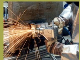
Eine Bildungseinrichtung der Kreishandwerkerschaft Bremerhaven-Wesermünde

Beispiele für die intensive Zusammenarbeit der InCoTrain GmbH mit ihren Kunden sind Firmenschulungen für führende Unternehmen aus Luft- und Raumfahrt, Anlagen- und Maschinenbau, Lebensmittelwirtschaft und Logistik.